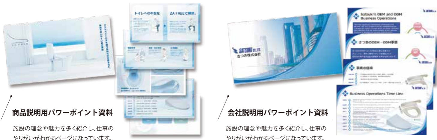
商品説明用パワーポイント資料