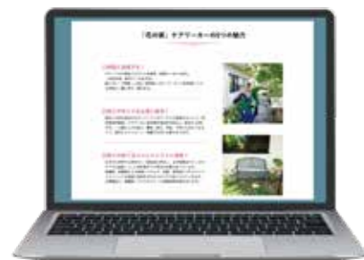
介護施設さまの採用ページ